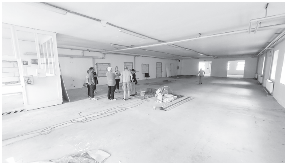
Der Bereich des zukünftigen Sortier- und Hauptlagers.