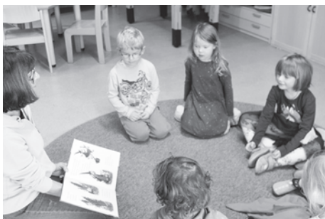
Bild Kindergarten Mittbach

„Lesen verbindet“ steht auf der Internetseite zum Vorlesetag. Nach dieser gelungenen Woche können wir dem nur beipflichten. Lesen und Vorlesen hat einen großartigen Zauber für den der liest und für die Zuhörer. Probieren Sie es aus!