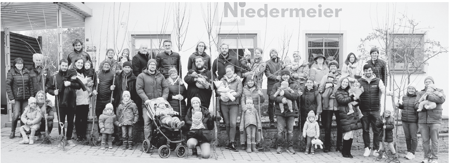
Insgesamt 23 Familien lösten in diesem Jahr ihren Willkommensgutschein ihres Babys ein. Die meisten waren persönlich zur Firma Niedermeier gekommen, um ihren Baum in Empfang zu nehmen.

Der Nachwuchs weiterer 23 Isener Familien wächst gemeinsam mit einem Bäumchen auf. Die Gemeindeverwaltung hat die seit 2022 bestehende Tradition fortgesetzt und jeden neuen Bürger des Marktes Isen zur Geburt mit einem