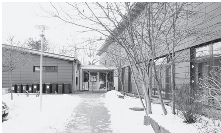
Ansicht Eingang Kinderhaus Isen