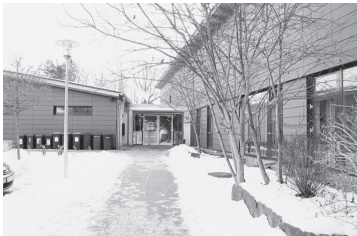
Ansicht Eingang Kinderhaus Isen